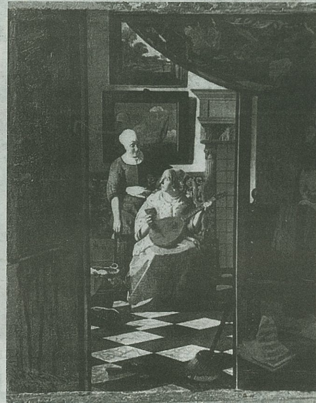
De Liefdesbrief van Vermeer (ca. 1669-70) FOTO RIJKSMUSEUM

De grote, witte dierfiguren die in de middenberm verrijzen, verwijzen naar afbeeldingen op oud-Delftse te-